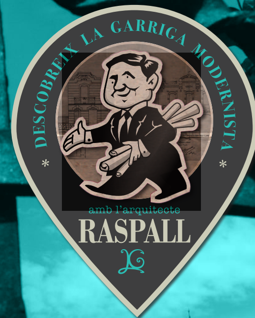
Idea i disseny: Simbolicat

10 i 11 de maig de 2024 XERRADES, VISITES GUIADES, TEATRALITZADES, PASSEJADA INTERACTIVA