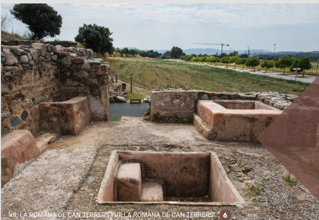
VIL·LA ROMANA DE CAN TERRERS | VILLA ROMANA DE CAN TERRERS 6

Observa la naturaleza y disfruta del entorno, pero no dejes huella.