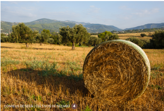
CONREUS DE SECA | CULTIVOS DE SECAÑO 4